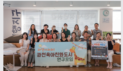
육아친화도시 연구모임 타운홀미팅