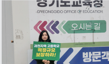
경기도교육청 릴레이 1인시위