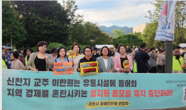
종교시설 용도변경 반대집회