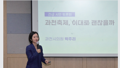
<과천축제, 이대로 괜찮을까> 토론회