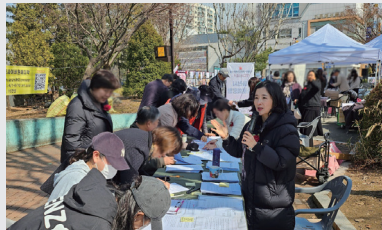
위례과천선 과천시 요구안 서명운동