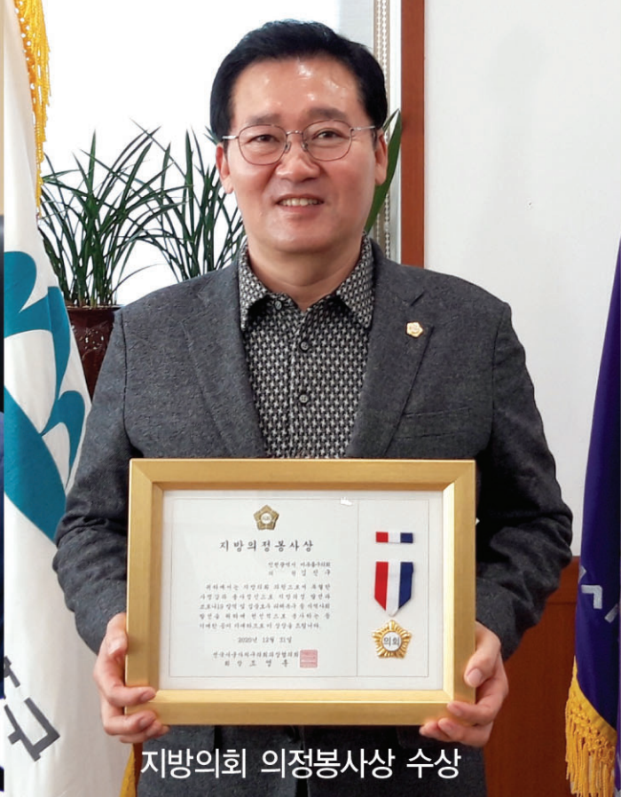
지방의회 의정봉사상 수상