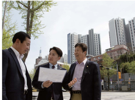
신촌로(마포더클래시 앞) 유턴차선 신설 약 4억 원