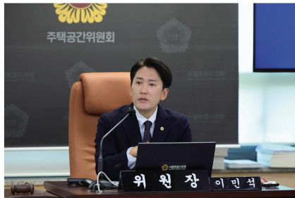
SH 사장 인사청문회 위원장

공덕1 세입자 대책 이행 방안을 이끌어냈고, SH와의 협업으로 입주민 삶의 질을 챙겼습니다.