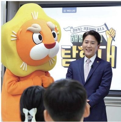
공덕초와 함께 한 <EBS 해통소통 탐험대>