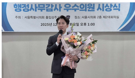
서울시의회 출입상주기자단 선정 행정사무감사 우수의원상 수상