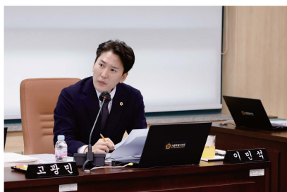
시민의정감사단 선정, 2년 연속 행정사무감사 우수등급 의원