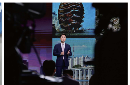
매니페스토 약속대상 좋은조례 우수상 (MBN 방송 출연)