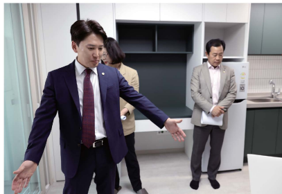
공덕동 행복주택 현장점검