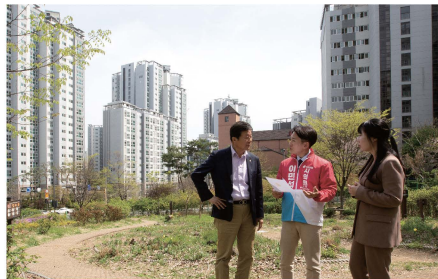
아현동 341-4 유휴부지 현장

마포래미안푸르지오 개발을 진행하며 공공청사 부지로 남겨둔 땅, 이제는 복합체육시설로 돌려드리겠습니다. 온 가족이 함께 땀 흘리고 소통하며 건강을 챙길 수 있는 우리 동네 맞춤형 운동 공간을 조성하겠습니다.