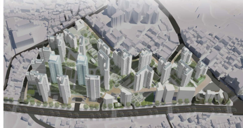
공덕 8 조감도