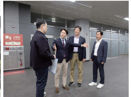
공덕역 편스테이션 조성 약 10억 원