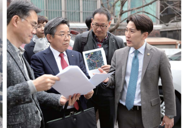
SH 사장, 아현1 공공재개발 현장 방문