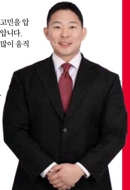
철원군의회의원선거 가 선거구