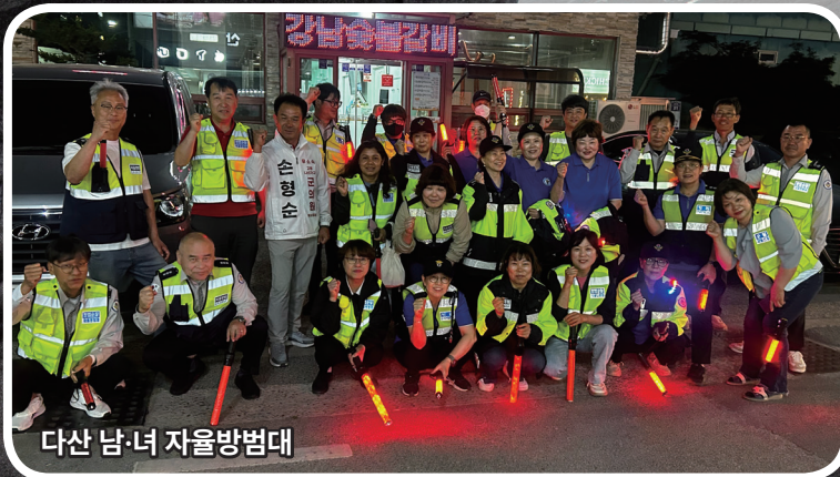
다산 남·녀 자율방범대