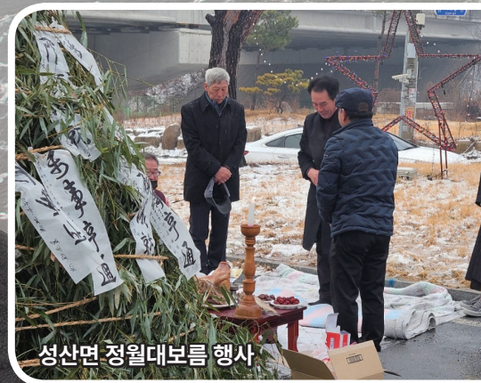
성산면 청월대보름 행사