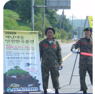
현장 안전 점검