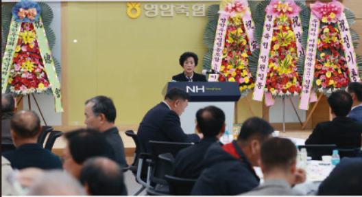
사)전국한우협회 영암군지부 정기총회 일시 : 2023년 3월 17일(금) 10:30 장소 : 영암축협 2층 대회의실