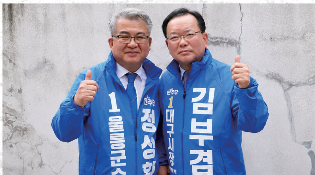
<대구시장후보 김부겸님과 함께 >