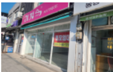
럼 비어 있는 보은 중심상가