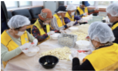
경로당 소일거리 지원사업