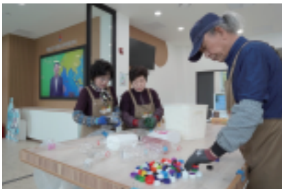
선순환 재활용 사업