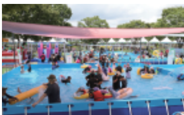
한시적 운영되는 체험놀이장 (물놀이장, 썰매장)