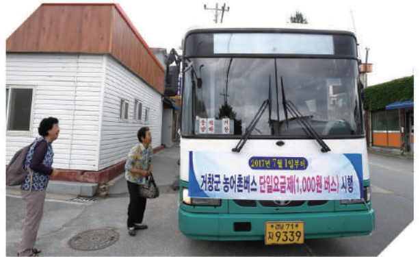
교통약자 승하차 불편 해소