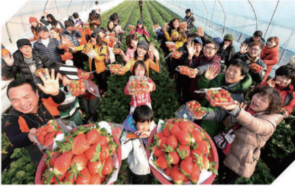
딸기 부산물 처리시설 설치