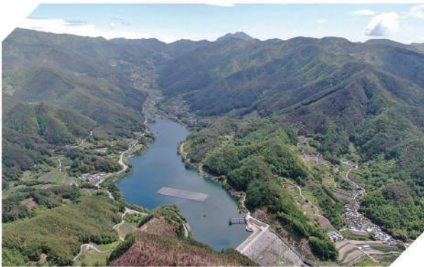
가북저수지 주변 및 단지봉 관광 자원화