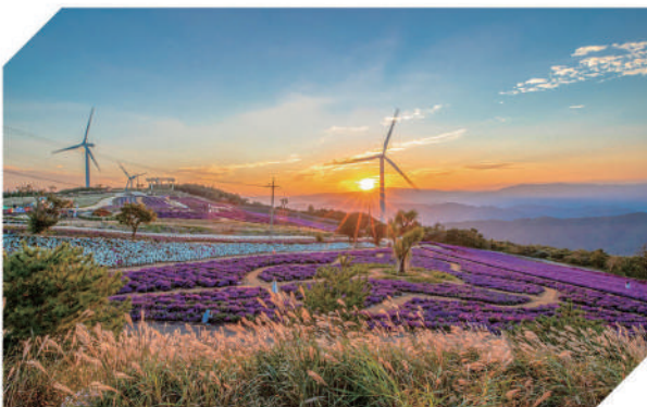
감악산 관광 우회도로 개설