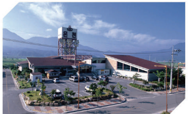
가조은천 관광단지 새단장 고견사 모노레일 설치