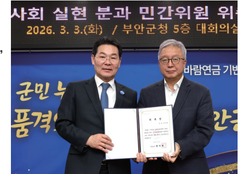
▲ 강남훈 대통령 직속 기본사회위원회 부위원장