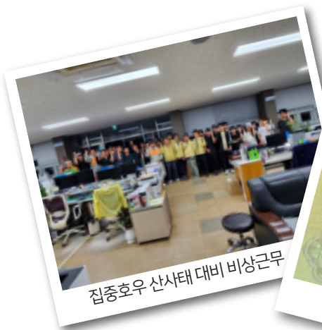
집중호우 산사태 대비 비상근무