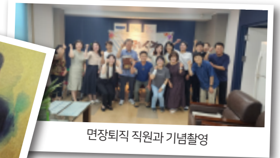
면장퇴직 직원과 기념촬영