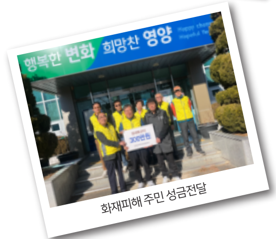
화재피해 주민 성금전달