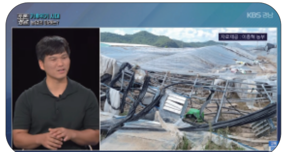
KBS 토론경남 2025.09.19 방송 갈무리

그 힘으로 남강댐 상류지역 매뉴얼 개선을 요구하는 주민대회를 준비하고 이끌었습니다.