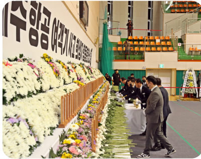
제주항공 여객기 사고 희생자 합동분향소 조문 (2024.12.31)