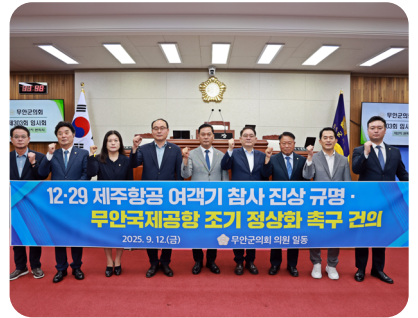
제303회 임시회 2차 본회의 (2025.09.12)