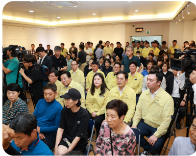
민주당 대표단 무안읍 침수지역 방문 및 주민 간담회(2025.08.08)