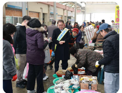
설맞이 무안 전통시장 장보기 행사 (2026.02.14)