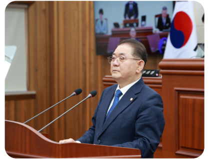
이익공유제/5분 자유발언 (2025.05.13.)