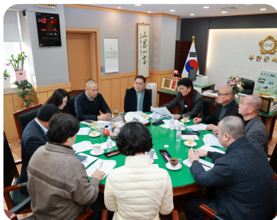
2월중 의원간담회 (2026.02.02)