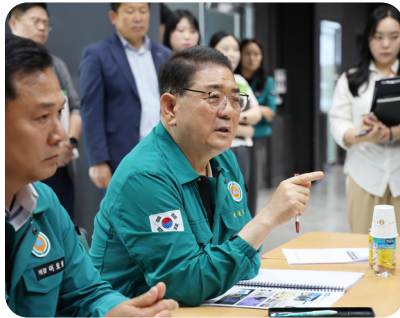
제302회 정례회 행정사무감사 특별위원회 운영 (2025.06.13)