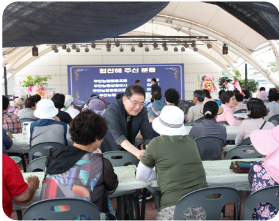
2025 해제면민 화합 한마당 (2025.07.04)