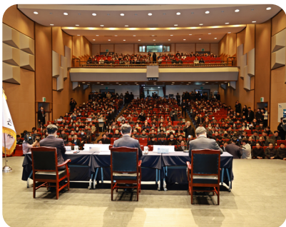
광주.전남 행정통합 도민 공청회 (2026.01.26)