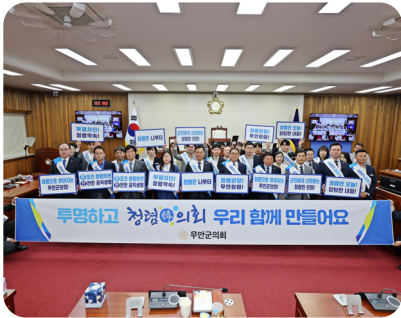
무안군의회 청렴 실천 서약식 (2025..05.13)