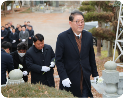
신년 충혼탑 참배 (2025.02.03)