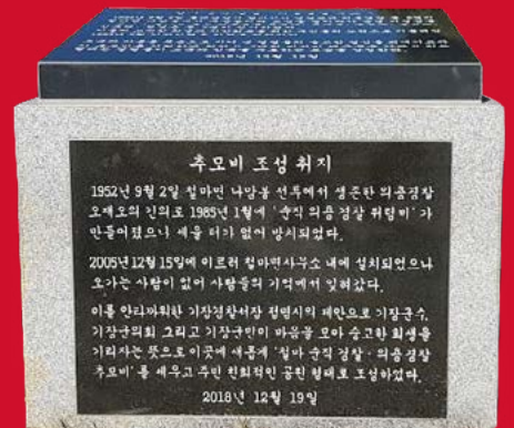
부산 기장군 철마면 철마체육공원 내 세워진 비석