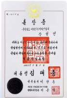
석탑산업 훈장 수훈