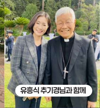
유흥식 추기경님과 함께