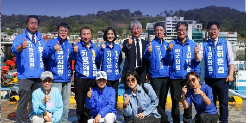
민주당 기장군 지방선거 출마자들과 함께