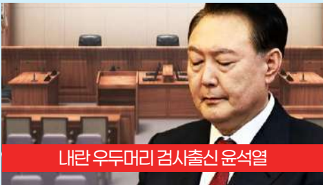
내란 우두머리 검사출신 윤석열