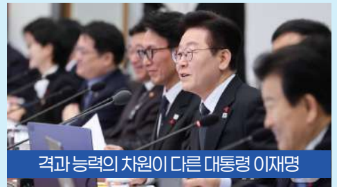
격과 능력의 차원이 다른 대통령 이재명