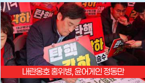
내란옹호 혐위병, 윤어게인 정동만