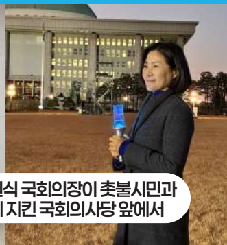
우원식 국회의장이 촛불시민과 함께 지킨 국회의사당 앞에서