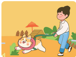
반려동물 놀이터 조성 공존하는 도시