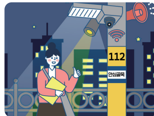
가로등 확대 설치 안심거리 만들기