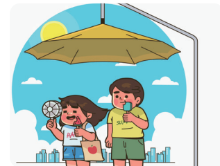
그늘막 대폭 확충 낙동강변 친환경 휴식공간 확대