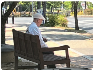
쉼터 의자 설치 지원 따뜻한 지역공동체