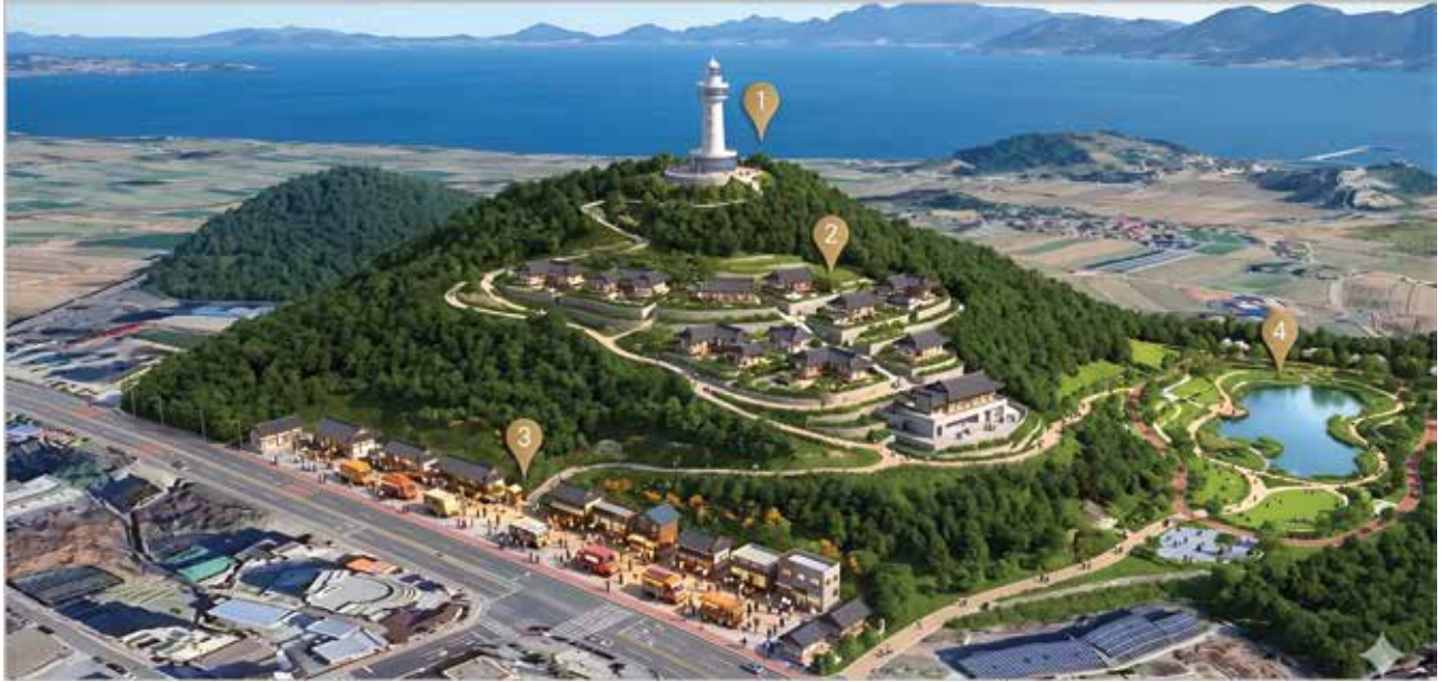
이 이미지는 이해를 돕기 위한 가상이미지입니다.