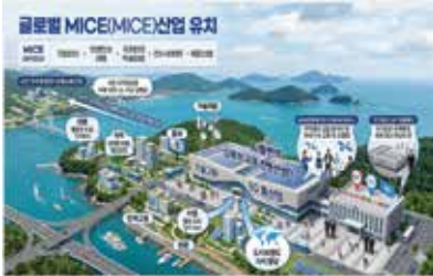
이 이미지는 이해를 돕기 위한 가상이미지입니다.

MICE산업 (기업회의, 인센티브 여행, 국제회의 학술대회, 전시·이벤트)은 단순 행사유치나 전시 운영을 넘어 참가자 이동, 숙박, 홍보, 기술지원, 인력고용, 관광, 교통, 도시 브랜드 가치 향상까지 한번에 움직이는 복합산업