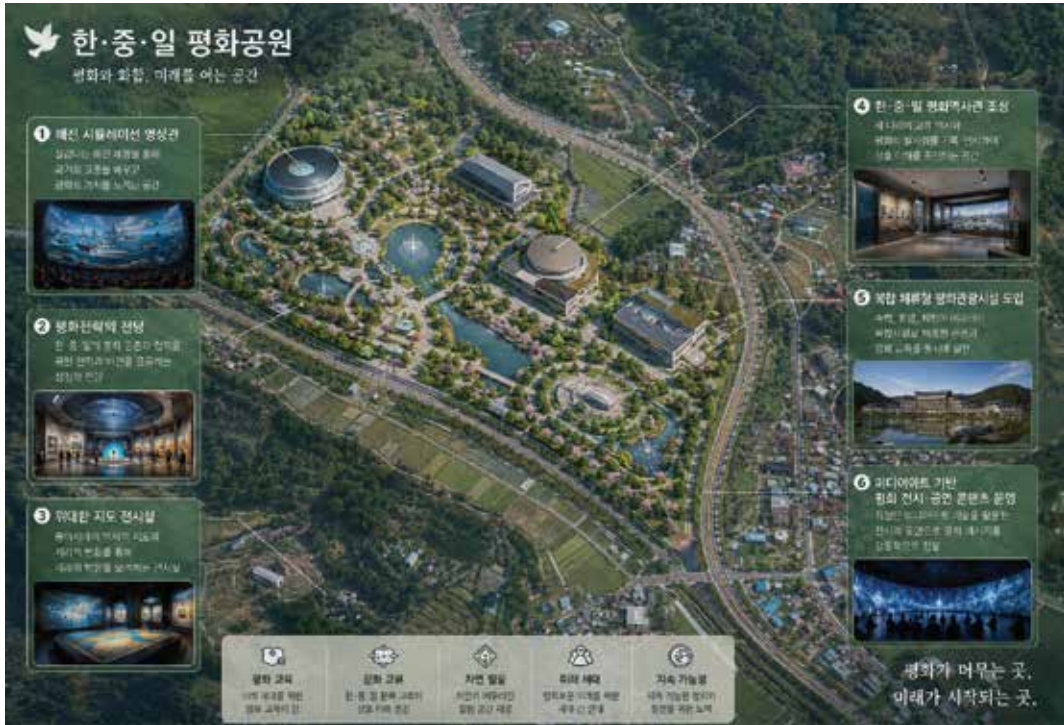
이 이미지는 이해를 돕기 위한 가상이미지입니다.