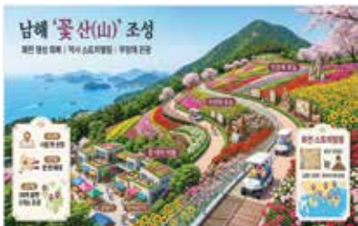
이 이미지는 이해를 돕기 위한 가상이미지입니다.