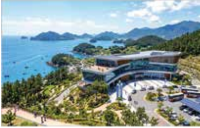
이 이미지는 이해를 돕기 위한 가상이미지입니다.