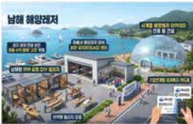
이 이미지는 이해를 돕기 위한 가상이미지입니다.