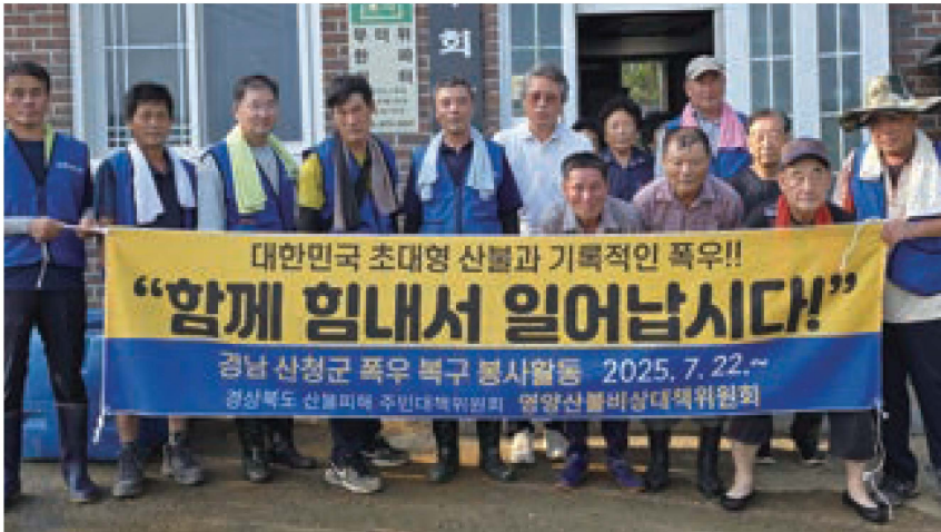
수해지역 복구작업 중