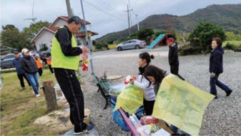
학생들과 현장학습 중