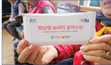
농민이라면 누구나 받는 농민수당, 앞장서서 지급 받을 수 있게 했던 사람 언제나 농민곁에 박웅두