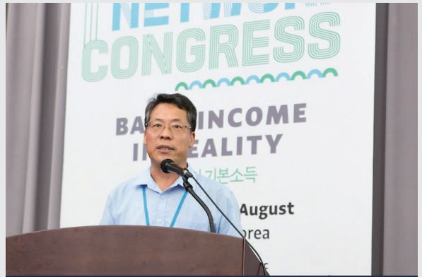
전국을 다니면서 토론회와 강연을 열었습니다. (2023. 08.23. 기본소득지구네트워크세계대회)