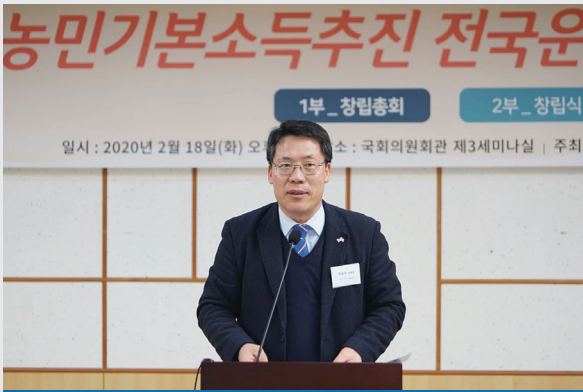
농어민기본소득전국운동본부 창립하고 (2020.02.18)