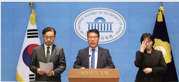
농어촌 기본소득 확대 환영! 구석구석 따뜻한 사회권 선진국으로!