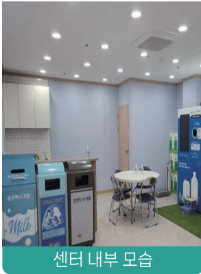
센터 내부 모습