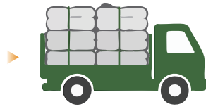
적체된 폐지 이동 및 저장