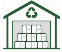
공공 비축창고 활용

사용하지 않는 미곡창고를 활용해 적체된 폐지를 공공 비축·관리하여 자원순환과 지역경제 활성화에 기여하겠습니다.