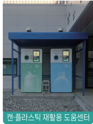
캔·플라스틱 재활용 도움센터