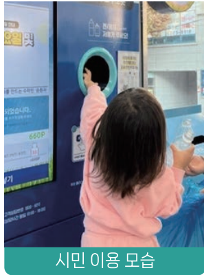
시민 이용 모습