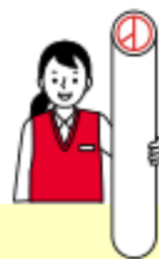
양양군의회의원 (나선거구) 투표