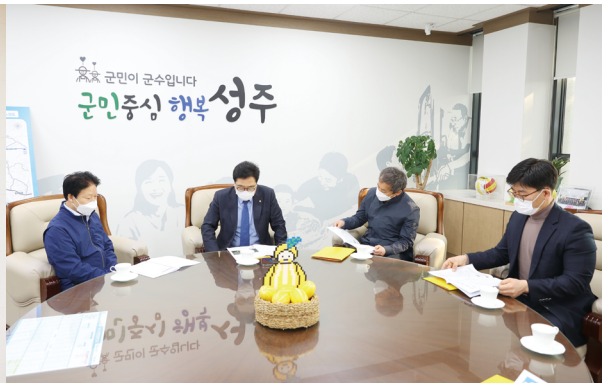
2021년 우원식 현 국회의장 성주군 방문