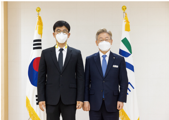
2021년 이재명 현 대통령과 함께

그동안 민주당 지역 책임자로서 성주군과 성주군의회와 소통하며 늘 지역 현안을 해결하는데 앞장서 왔습니다.