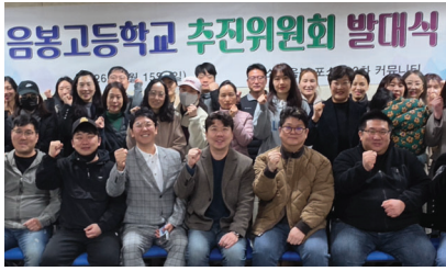
음봉고 추진위원회 발대식