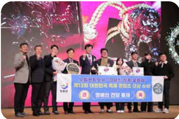
제13회 대한민국 축제 콘텐츠 대상