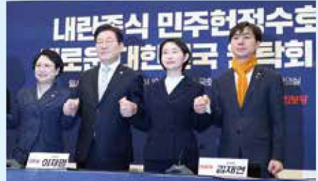
*내란종식 민주헌정수호 새로운 대한민국 원탁회의 출범식(25.2.19) 윤석열 탄핵 심판에 따른 조기 대선에서 국민의힘 재집권 저지를 위해 당시 5개 원내야당이 공동으로 출범