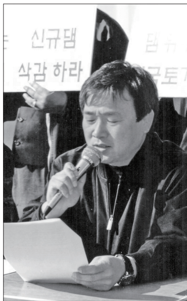
섬진강 적성댐 건설 반대 기자회견

동계 장군목을 물 속에 가두려는 섬진강댐 건설계획을 군민과 함께 막아냈습니다. 공교육과 옥천인재숙 문제를 당시 학부모들