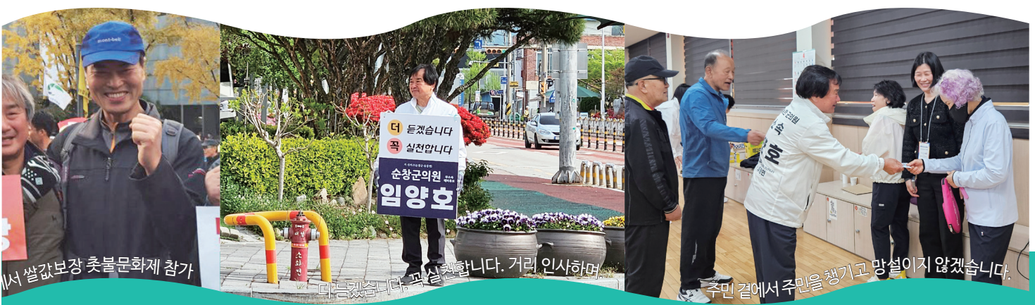
에서 쌀값보장 촛불문화제 참가 들겠습니다. 꼭 실천합니다. 거리 인사하며 주민 곁에서 주민을 챙기고 망설이지 않겠습니다.

“앞에서는 예,예, 하지만 실천을 안 해. 쓸만하다 생각 했는데 영 마땅치 않아.”