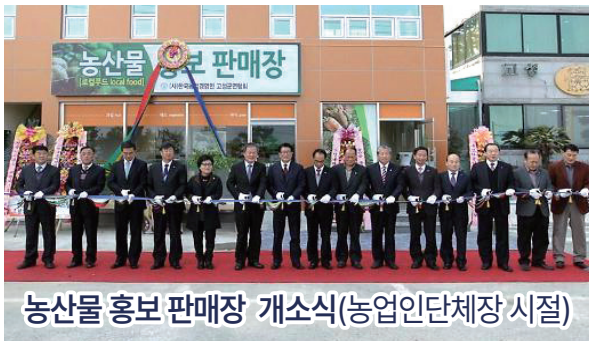
농산물 홍보 판매장 개소식(농업인단체장 시절)