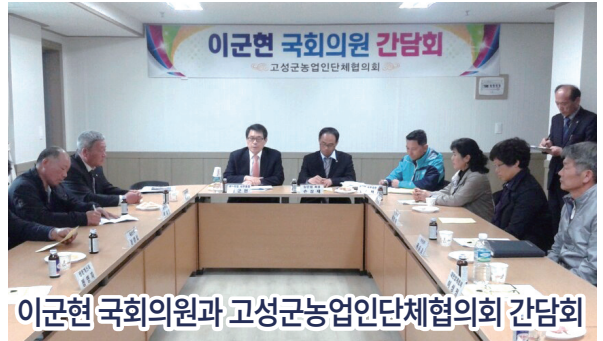
이군현 국회의원과 고성군농업인단체협의회 간담회