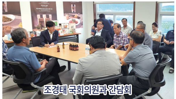
조경태 국회의원과의 간담회