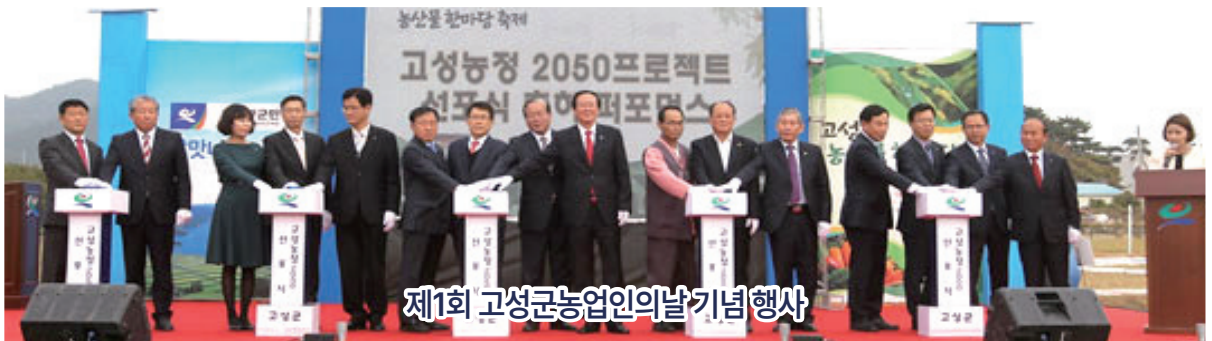
제1회 고성군농업인의날 기념행사