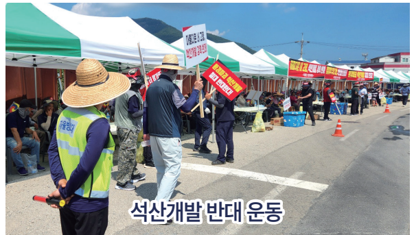
석산개발 반대 운동