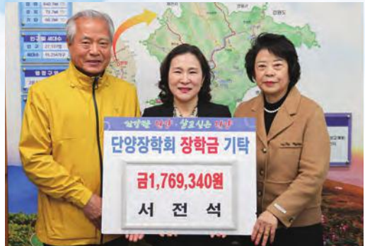
2026. 04. 07. 단양장학회에 국민연금 1개월 수령분 1,769,340원 장학금 기탁

단성 두향국민학교 11회(1969), 단양중학교 25회(1972), 충주상업고등학교 4회(1975) 세경대학교 사회복지학과 졸업(야간 2024)