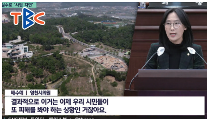
▲마현산공원 조성 차질 지적

배수예 의원, "영천시, 영천 학생 입학 보장 없는 명문고 유치는 무의미"