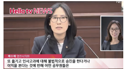
▲'위장전입' 의혹 관련 시정질의