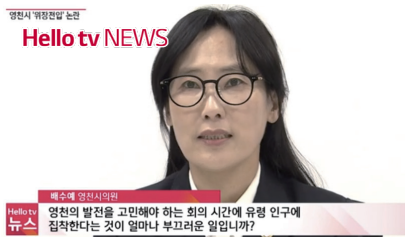
▲영천시 '위장전입' 논란 공론화