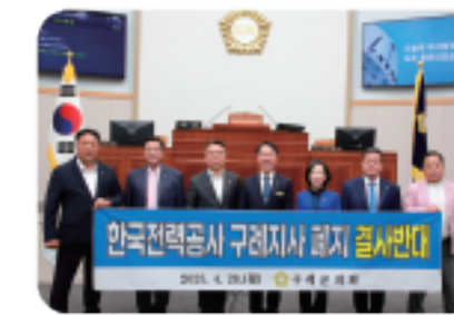
한전 구례지사 폐지 반대 결의