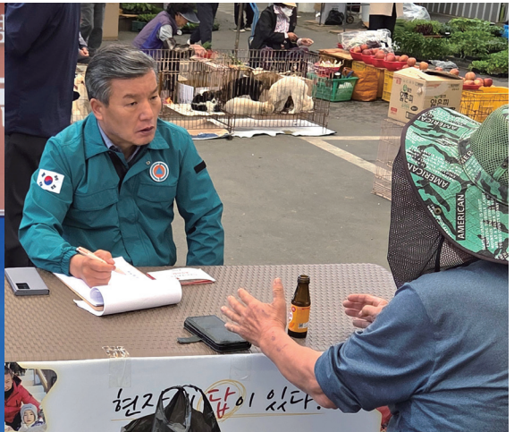
↑ 별고를 신문고-현장에 답이 있다. (현장상담, 민원상담)