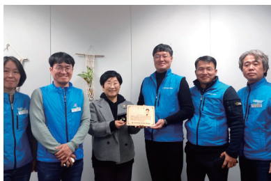
공무원 노조의 감사패 전달