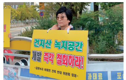
건지산 개발 반대 활동