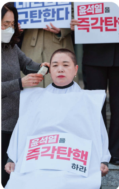
윤석열 파면 촉구