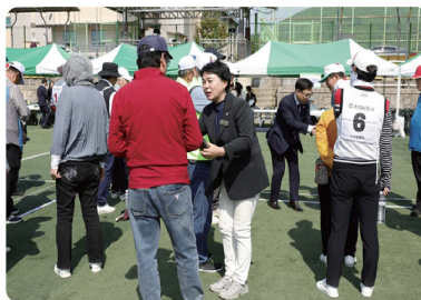
순천시장기 게이트볼 대회