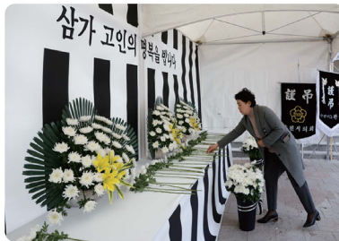
제주항공 여객기 추락사고 참사 합동분향소 참배