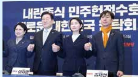
*내란중 민주헌정수호 새로운 대한민국 원탁회의 출범식(25.2.19) 윤석열 탄핵 심판에 따른 조기 대선에서 국민의힘 재집권 저지를 위해 당시 5개 원내야당이 공동으로 출범