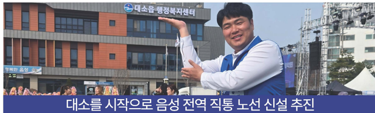
대소를 시작으로 음성 전역 직통 노선 신설 추진

아파트 단지에서 관내 주요 거점까지 중간 정차 최소화한 직통 순환 버스 집중 배치!