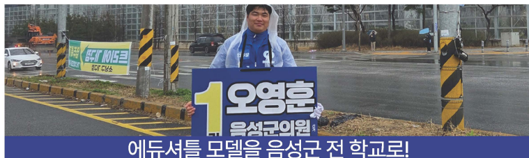
에듀셔틀 모델을 음성군 전 학교로!