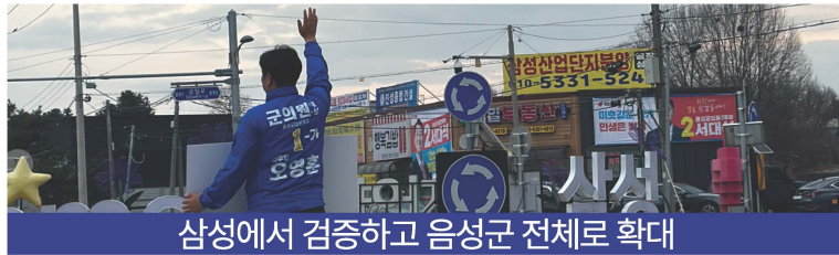
삼성에서 검증하고 음성군 전체로 확대

거리 중심인 현재 기준(마을회관에 500m)에 수요자 중심(교통 약자) 기준을 추가!