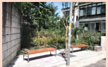
돌봄행복마을 주거환경관리사업 조경공사