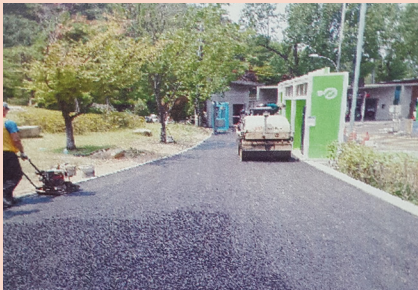
관내 도로굴착 복구공사