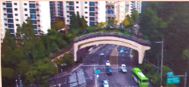
호압로 녹지연결로 조성사업