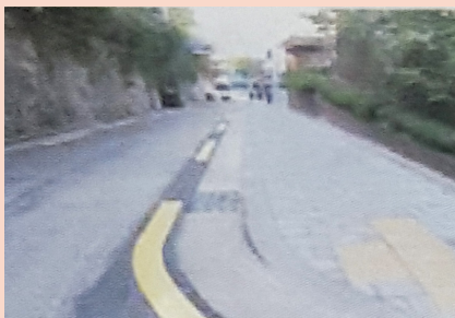
삼성동, 대학동 보도설치 정비