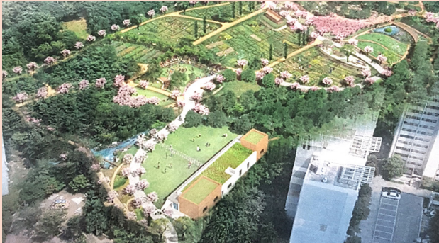
관악산 도시농업공원 조성 (삼성동 86-6 외 2필지)