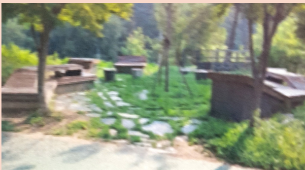
신림6배수지 테마공원 조성공사 (삼성동 336-8 신림6배수지(하늘공원))