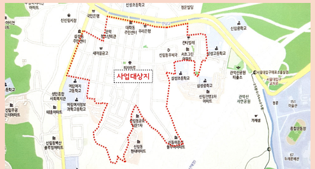
신림동 고시촌 도시재생사업 추진 대학동 일대 (480,000㎡)