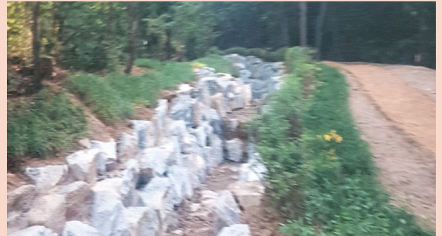
삼성동 등 산사태 예방공사 (삼성동 산 57-13 일대 산사태 취약지역)