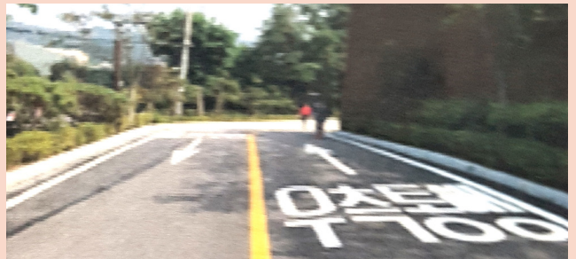
관악산 관문 등산로 정비사업