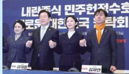
*내란중 민주헌정수호 새로운 대한민국 원탁회의 출범식(25.2.19) 윤석열 탄핵 심판에 따른 조기 대선에서 국민의힘 재집권 저지를 위해 당시 5개 원내당이 공동으로 출범