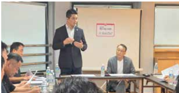
3 / 경기도 경기살리기 톡크세일 효율성 제고 및 확대 지원