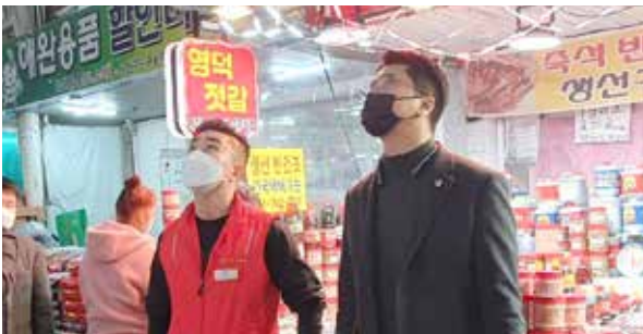
3 / 상동시장, 중동사랑시장 아케이드 등 노후시설 개선