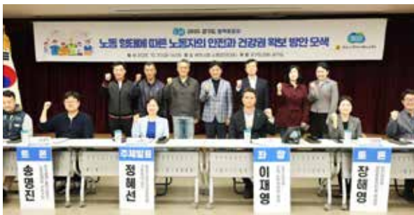
5 / 플랫폼 프리랜서 노동자의 안전과 건강권 확보 방안 모색