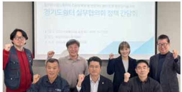
4 / 이동노동자쉼터의 확대 및 효율적인 운영방안 지원