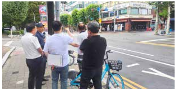
4 / 중동 팰리스카운티 교차로 등 지역별 생활밀착형 보행환경 개선