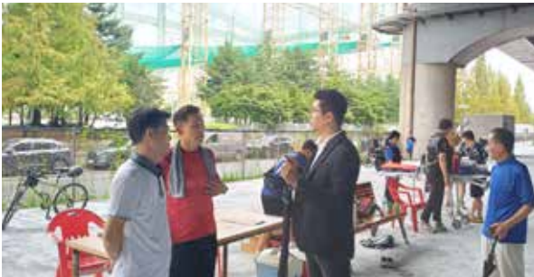
1 / 상동 해그늘체육공원 내 게이트볼장, 족구장, 테니스장 등 노후된 시설 개선

경기도특별조정교부금 확보 등 외부재원 확보로 지역 내 주민편의시설 등을 개선!