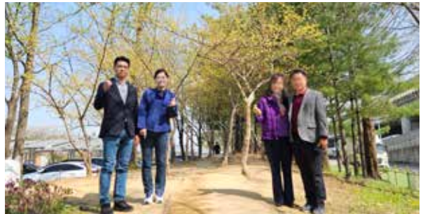
2 / 상동호수공원, 석천공원, 소망·도담 어린이 공원 등 어린이 놀이시설, 노후시설 개선