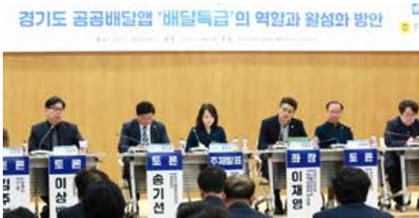
1 / 경기도 공공배달앱 배달특급 활성화 방안 모색

현장에서 시민의 목소리를 듣고 골목상권과 전통시장 활성화 및 노동의 사각지대를 해소하고자 각 주체들과 소통하며 개선방안을 모색했습니다