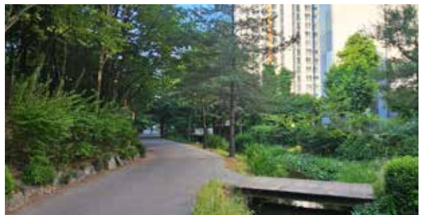
5 / 상동 시민의강 개·보수 및 생태하천 조성