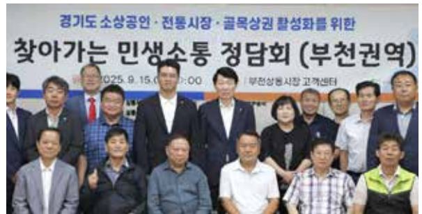
2 / 전통시장, 골목상점가, 사회적경제, 소상공인 조직 지원