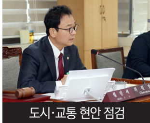
도시·교통 현안 점검