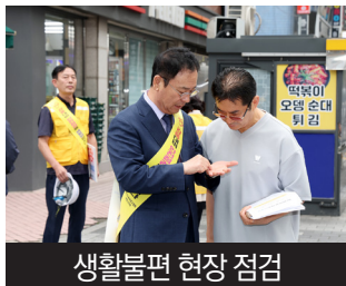
생활불편 현장 점검