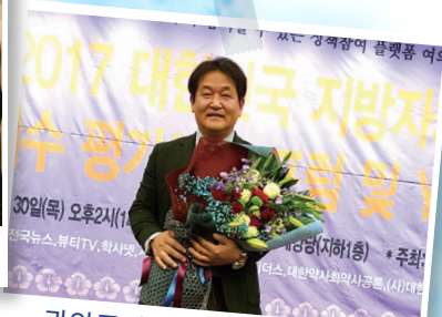
관악주민연대 전반기 관악구 의원평가 정책/제안 분야 1위