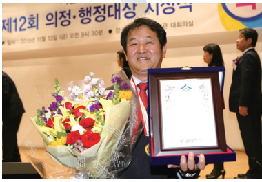
시민일보 주관 의정대상 수상