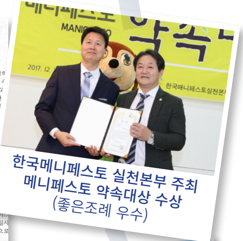
한국메니페스토 실천본부 주최 메니페스토 약속대상 수상 (좋은조례 우수)

민 의원은 "남향동은 주차장 문제가 심각해 그동안 어느 누구도 해결하지 못했지만 남곡동 GRT 작고지 1곳에 평의 서울시 부지를 주차장 건립할 것을 제안하자 관악구 집행부가 받아들여 서울시와 협의한 결과 대체하고지 마련 조건으로 주차장 건립