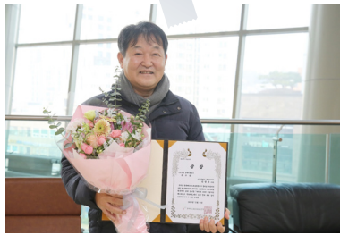
한국메니페스토 실천본부 공약이행 부문 우수상 수상

지킬 수 있는 약속만 드리겠습니다 표만 얻고 돌아서서 말 바꾸는 그런 정치는 끝내겠습니다