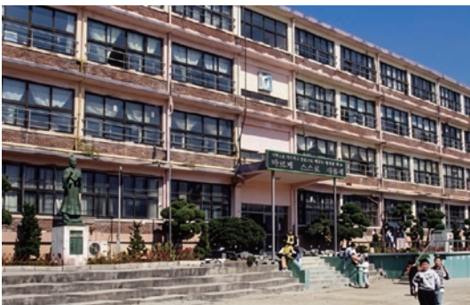
*당시 자양초등학교 전경

자양동에서 태어나 광진의 흙을 밟으며 자랐습니다. 자양초등학교와 광진중학교, 광양고등학교를 다니며 어린시절 꿈을 키웠습니다. 광진구 골목 구석구석이 이상엽의 고향이자 삶의 터전입니다.