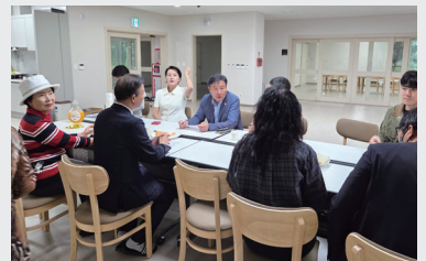
마동 풍경채 경로당 간담회