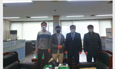
마동 GS자이 간담회