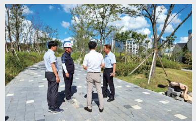
마동공원 현장 방문