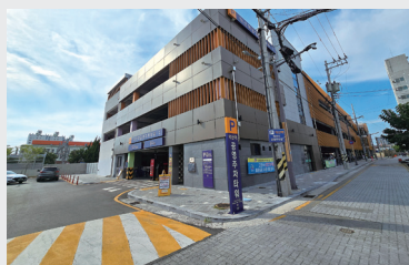
익산역 남부 공영주차 타워