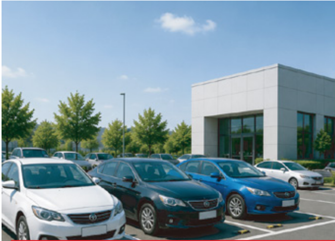
주차난 해결 (공영주차 확대, 공유주차 도입)