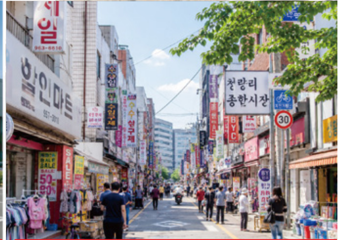
골목상권 활성화 (소상공인 지원 확대)