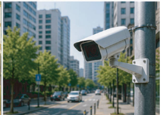
안전한 생활환경 (CCTV·보행환경 개선)