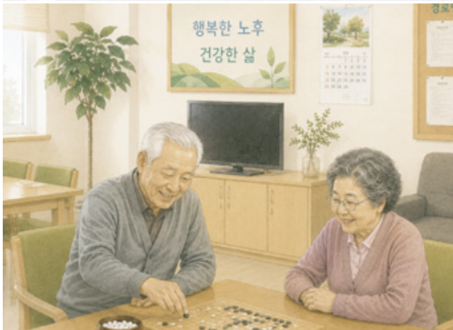
어르신 복지 강화 (경로당·돌봄 확대)