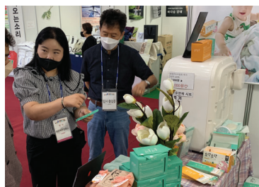
2022 보령 해양머드박람회 참가기업