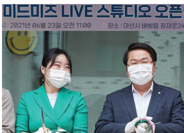
(코로나19) 온라인라이브커머스 소상공인 마케팅지원