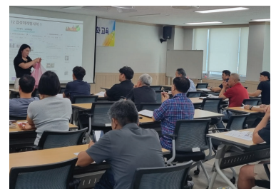
(재)충남경제진흥원 농사랑 쇼핑물 입점기업 마케팅교육