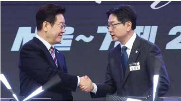
60년 숙원, 서부경남KTX 착공식 이재명 대통령과 함께! (2026.02.06.)