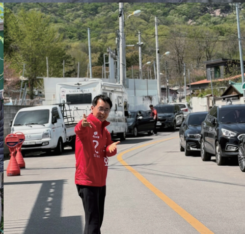
2017년, 다락원 2022년 망월사역 앞 소방도로 개설에 앞장섰습니다.