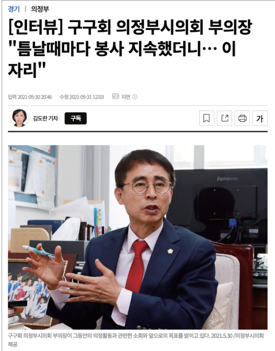
2021.5.30. 경인일보 보도