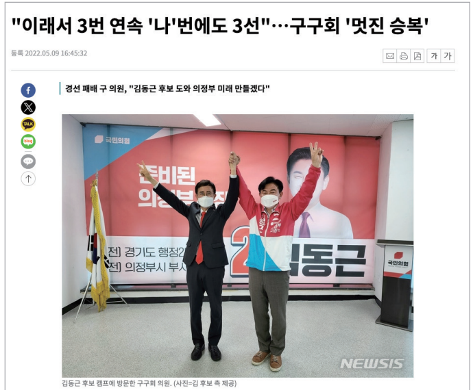
2022.5.9. 뉴스시 보도