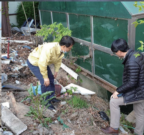
2020년 4월, 쌍용아파트 앞 방치된 공간. 10년동안 미해결된 민원을 해결했습니다.