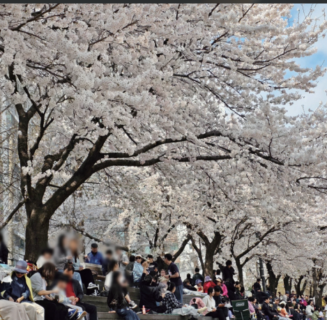
의정부 명소 중랑천 벚꽃길 조성 구구회가 한 몫 했습니다. (조선의원 - 벚꽃길 조성건의)