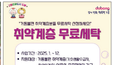
취약계층 무료 세탁 사업