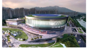
서울아레나 27년 5월 완공