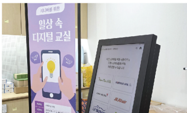
어르신 디지털 취약계층 활동 지원