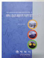
태백시 중심의 폐광지역 자생적 발전방안 연구 (공저, 2008년)